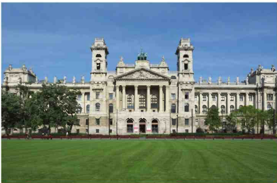
מימין למעלה: בתי משפט בהונגריה, פולין, בריטניה; מימין למטה: ארצות הברית, קנדה ופינלנד

היא מדינה עם מסורת דמוקרטית רבת שנים, ויש בה תרבות דמוקרטית מבוססת ומוסכמות חוקתיות רבות; יש דברים שפשוט לא עושים. כך, למשל, ב-2018 השר להתפתחות בינלאומית, לורד בייטס, התפטר מתפקידו רק משום שאיחר להגיע לדיון"